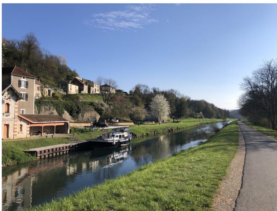
Chemins de halage du Canal entre Champagne et Bourgogne

Les données relatives à l'équilibre des missions est présenté en annexe 2.