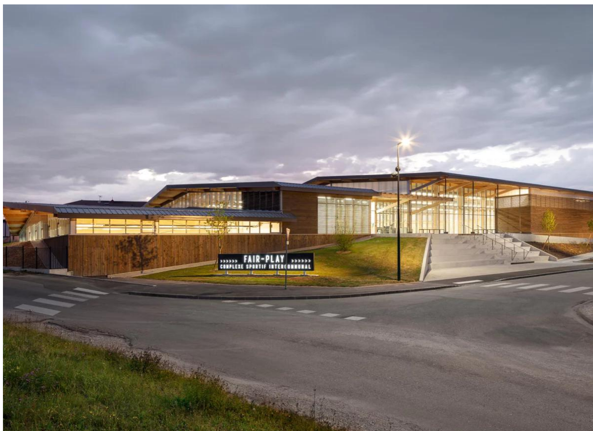
Fair-Play, le complexe sportif du Bassin de Joinville (CCBJC)

L'équilibre entre le fonds de roulement et les engagements en gestion assure la soutenabilité de l'activité du GIP Haute-Marne.