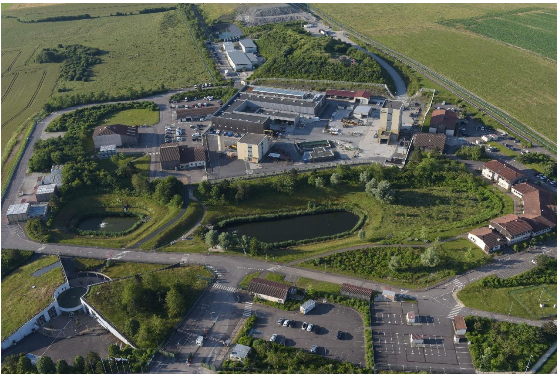
Le Centre de l'Andra en Meuse/Haute-Marne prépare et contribue au projet Cigéo.