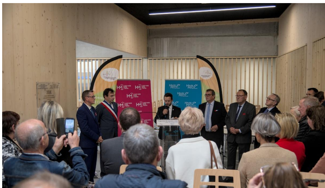
Inauguration de l'école Diderot et du Collège Joseph Cressot à Joinville

Globalement, l'intensité des engagements financiers 2023 du GIP Haute-Marne s'élève à 289 € par habitant sur la zone de proximité et à 101 € par habitant hors zone de proximité. Cette intensité de financement reflète la priorité effectivement accordée à la zone de proximité.