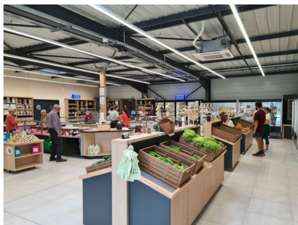
Esprit Paysan magasins de producteurs